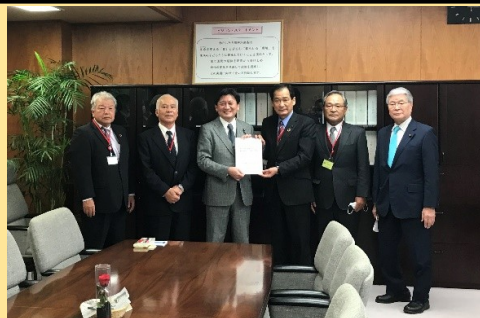
〔R3.12.1 武部新農林水産副大臣への要請〕

私どもの要請内容をしっかり受け止めて頂き、産地の声を国政の場で代弁するとともに、農水省等に働きかけて頂いた森山先生、野村先生をはじめとする県選出国会議員、自民党農林幹部議員の先生方のご尽力により、主要な要請事項が実現する見込みとなりました。