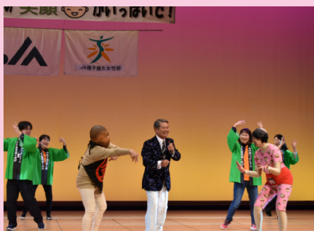
▲盛り上がりました