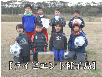
【ライビエント種子島】