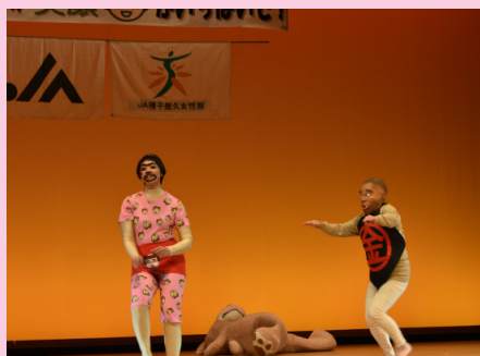
▲おもろい2人（南種子支部）