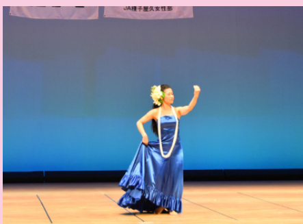
▲西之表一般参加によるフラダンス