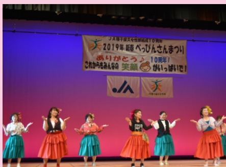
▲かんかん娘（西之表支部）