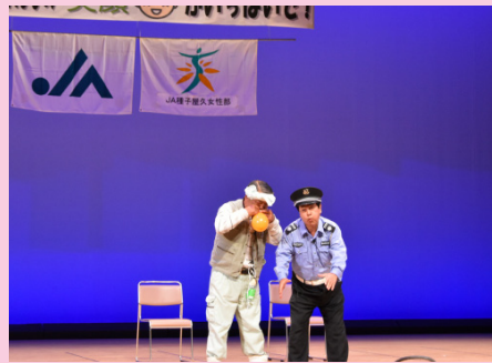
▲寸劇「酔っ払いと警察官」