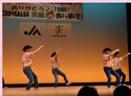
▲中種子町一般参加による男子フラ