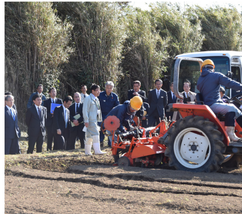
▲マルチ張りの実演

西之表市の県農業開発総合センター熊毛支場では、マルチ張りの実演を行いました。マルチの効果や生分解性マルチ（除去労力や廃棄費用が不要）とポリエチレンフィルムとの比較をしました。同委員会からは、生分解性マルチは畑に残らないか、価格差ほどの程度なのかなどの質問がありました。 沖縄農業研究センター種子島拠点では、サトウキビの新品種（KY10・1380）についての説明があり、主要品種「農林8号」と比べ、茎数が多く、株出し萌芽性にも優れるため多収で、種子島の土壌に適しているとの説明がありました。同委員会からは、「あまみ・沖縄にも適しているか。いつから農家に配布できるか。」との質問がありました。