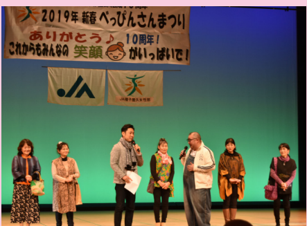
▲女性部リメイクショー