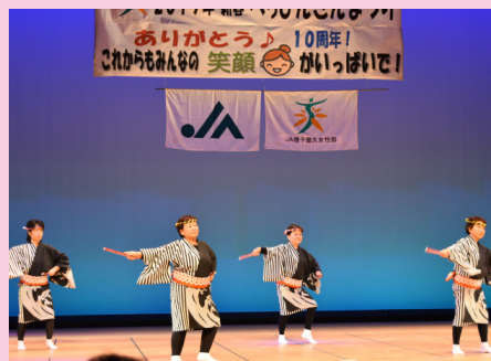
▲ソーランまつり節（中種子支部）