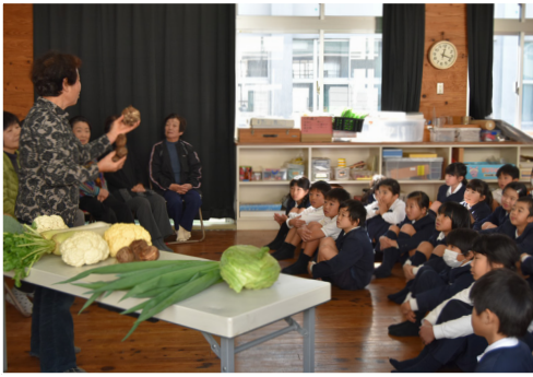
児童 野菜の話に夢中

また、部員からは、「農業の次世代を担う子どもたちになってほしい。これからも新鮮な野菜を届けていきたい。」と述べました。